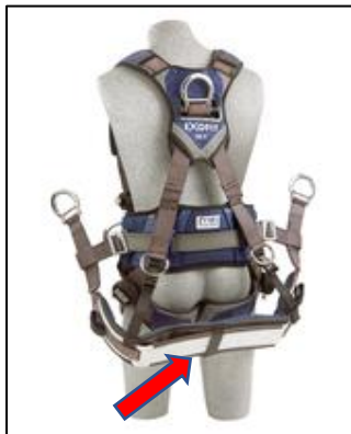
La flecha roja señala la eslinga de asiento del ejemplo

3M Fall Protection ha recibido informes que indican que la placa de refuerzo de aluminio que se usa en la eslinga de asiento puede desprenderse del tejido trenzado en ciertos arneses ExoFit™, ExoFit XP™ (incluyen los modelos para arco eléctrico) y ExoFit NEX™ (incluyen los modelos para arco eléctrico) DBI-SALA. En algunas circunstancias, la placa de asiento de aluminio se ha separado del arnés y se ha caído al suelo, lo que crea el peligro posible de una caída de un objeto. No hemos recibido ningún informe de lesiones o accidentes asociados con esta condición. El desempeño de los arneses no se ve afectado por este problema, por lo que cumplirán correctamente con su propósito en todo momento, hasta como sujeción del cuerpo para un sistema de detención de caídas personal en caso de que se produzca una caída, incluso sin la comodidad adicional que ofrece la eslinga de asiento.